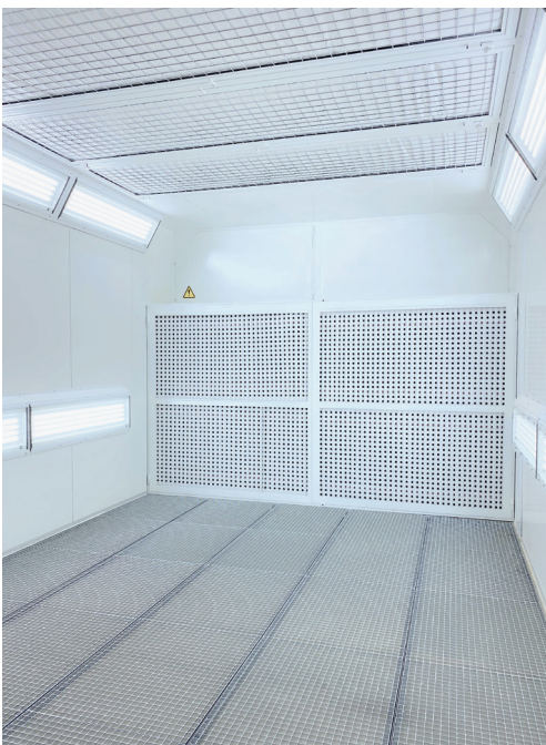
Grosszügige Farbspritzkabine mit Wandabsaugung und integrierten Decken- und Wandleuchten in LED-Technik für eine optimale Ausleuchtung.

Sämtliche Teile werden nach dem Schleifen auf Hordenwagen in die Farbspritzkabine gefahren und dort manuell beschichtet.